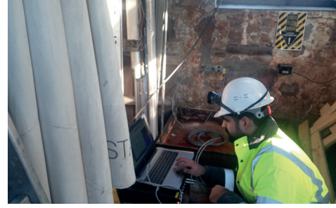
Türkiye'nin önde gelen yapı sağlığı izleme projelerinde cihazların montajı ve ölçülmesi uzman bir ekip liderliğinde gerçekleştiriliyor.

Hasar tespiti yapılabilmesi için algılayıcıların bina sağlamken yerleştirilmesi gerekiyor. Bu tür yapısal takip sistemleri aslında dünyanın farklı ülkelerinde elli yıldan uzun bir süredir üretiliyor. Türkiye’de ise cihazlar uzun yıllar yurtdışından temin edilmiş. İlk müşteriler de üniversitelerde Ar-Ge çalışmaları yapan akademisyenler olmuş. Ancak yurtdışından alınan cihazların hem pahalı olması hem de akademisyenlerin tüm ihtiyaçlarına cevap verecek nitelikte olmaması bu alanda yeni bir üretim ihtiyacı doğurmuş. Ta ki Teknik Destek Grubu (TDG) piyasaya girmeye karar verene kadar. TDG işe öncelikle akademisyenlere yurtdışından temin edilen cihazların kullanımıyla ilgili teknik destek vererek başlamış. Laboratuvarında yapılan deprem mühendisliğine ilişkin