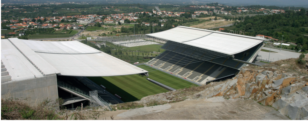
2004 Avrupa Futbol Şampiyonası'nın düzenlendiği Portekiz'deki Braga Stadyumu'nun asma çatısı da incelenen yapılar arasında.

Dolayısıyla cihazın laboratuvar ortamındaki araştırmalardan kamu binalarına (örneğin hastanelere), köprülere ve tünellere, tarihi eserlerden kule tipi yüksek yapılara ve stadyumlara kadar çok geniş bir kullanım alanı var. Örneğin Kandilli Rasathanesi'nde laboratuvar ortamında hazırlanan düzeneklerdeki deprem simülasyon test kontrolörü firmanın ürünü.