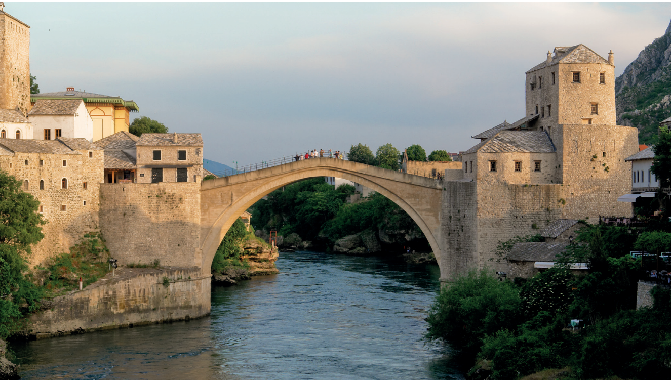
2003 yılında restore edilen tarihi Mostar Köprüsü de yapısal sağlık takibi yapılan örnekler arasında.

TDG bu bileşenlerin çoğunluğunun tasarımını, üretimini ve montajını Türkiye’de gerçekleştiriyor. Firmanın sunduğu cihazlar hem yurtdışına bağımlılığı önlemiş hem de benzerlerinden daha pratik. Aynı zamanda esnek, yani kullanıcının ihtiyacına cevap verecek biçimde yenilenebiliyorlar.